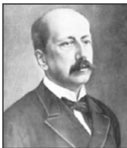
Χαρίλαος Τρικούπης (1832-1896). Πρωθυπουργός της Ελλάδας 1882-1885, 1886-1890 και 1892-1893.

Οι κυβερνήσεις του Χαριλάου Τρικούπη, στη συνεχή και άοκνη προσπάθειά τους για την ανασυγκρότηση των Ενόπλων Δυνάμεων της χώρας και την ποιοτική βελτίωση των στελεχών (Αξιωματικών και Υπαξιωματικών) του Στρατού, σταδιακά έλαβαν, εκτός των άλλων, μια σειρά νομο-