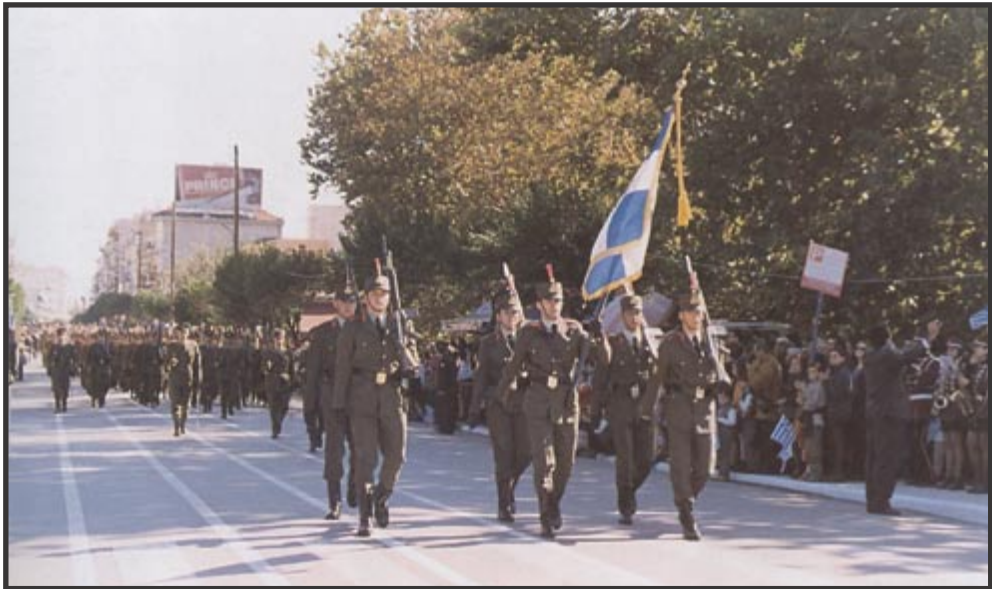
Παρέλαση της Σχολής Μόνιμων Υπαξιωματικών στα Τρίκαλα.

Σήμερα, τέλος, η Σχολή Μόνιμων Υπαξιωματικών, με το αξιόλογο ιστορικό παρελθόν της, την πολύτιμη προσφορά της και την αξιοζήλευτη θέση που επάξια κατέχει στις Ανώτερες Στρατιωτικές Σχολές των Ενόπλων Δυνάμεων, αλλά και με ευοίωνες προοπτικές, πρέπει να απενίξει με αισιοδοξία το μέλλον ως η μοναδική παραγωγική Σχολή κατώτερων στελεχών του Ελληνικού Στρατού.