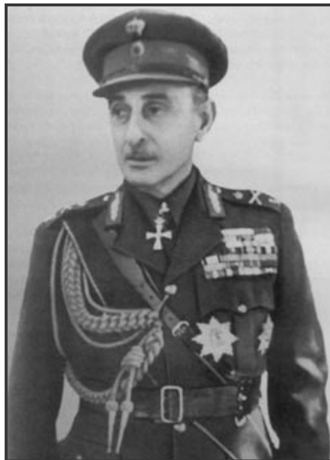
Στρατάρχης Αλέξανδρος Παπάγος, Αρχιστράτηγος 1949-1951.

Στα μέσα περίπου της δεκαετίας του 1940 και λίγο χρόνο μετά την Απελευθέρωση της πατρίδας από τα ξένα στρατεύματα, η από την εποχή της τριπλής Κατοχής και της Εθνικής Αντίστασης (1941-1944) αναπτυσσόμενη εμφύλια ιδεολογική αντιπαράθεση στο εσωτερικό της χώρας συνεχίστηκε πιο έντονη, για να καταλήξει στις αιματηρές πολεμικές επιχειρήσεις Ανταρτοπολέμου της τετραετίας 1946-1949. Απότοκος της επικρατούσας τότε κρίσιμης πολεμικής κατάστασης ήταν και η από μέρους της