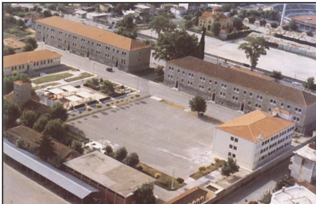
Τρίκαλα: Το σημερινό στρατόπεδο της Σχολής Μονίμων Υπαξιωματικών.

Η στολή εξόδου ή περιπάτου των μαθητών από το 1949 μέχρι το 1985 ήταν