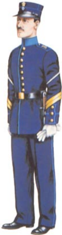
Βαθμοφόρος μαθητής της ΣΣΥ 1926-1937

Με την πάροδο του χρόνου και τη σημειωθείσα στο μεταξύ σημαντική εξέλιξη στον Ελληνικό Στρατό, το Στρατιωτικό Σχολείο Υπαξιωματικών καταργήθηκε οριστικά πλέον το 1937. Το μέχρι τότε σοβαρό έργο του είχαν αναλάβει: από το 1934 η Στρατιωτική Σχολή Ευελπίδων (εκπαίδευση σπουδαστών Όπλων) και από το 1937 η νεοσύστατη τότε “Σχολή Αξιωματικών Στρατιωτικών Υπηρεσιών-ΣΑΣΥ” (εκπαίδευση σπουδαστών Σωμάτων και Υπηρεσιών), με την οποία τελικά και συγχωνεύτηκε τον ίδιο χρόνο.