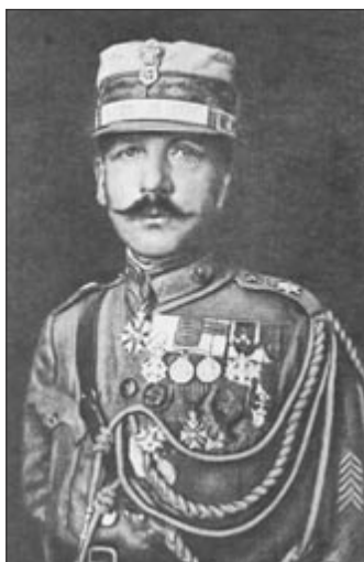
Αντισπράττης Θεόδωρος Πάγκαλος. Πρωθυπουργός 1925 - 1926. (φωτ. «Ιστορία του Ελληνικού έθνους» τόμος ΙΕ)

νταν οι απαραίτητες οδηγίες για την όσο το δυνατόν ταχεία και άρτια συγκρότηση και οργάνωση των τριών νέων στρατιωτικών Ιδρυμάτων.