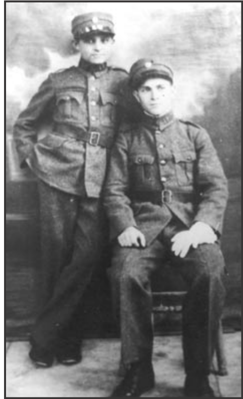
Στρατιώτες Μαθητές της ΠΣΥ 1926 - 1934

Κατ' αυτόν λοιπόν τον άδοξο, θα λέγαμε, τρόπο διαλύθηκε στο τέλος Ιουνίου του 1934, για δεύτερη φορά στην ιστο-