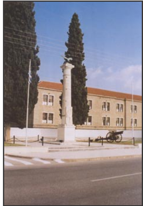
Τρίκαλα: Σχολή Μόνιμων Υπαξιωματικών 1975-2004.

Και στις τρεις περιόδους της λειτουργίας της η Σχολή, με υψηλό αίσθημα ευθύνης, κατέβαλε και συνεχώς καταβάλλει κοπιώδεις προσπάθειες, για να εκπληρώσει επάξια τον τόσο σοβαρό ρόλο της, παρά τις κατά